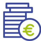
Economics & Policy