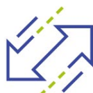
Traffic Management & Modelling